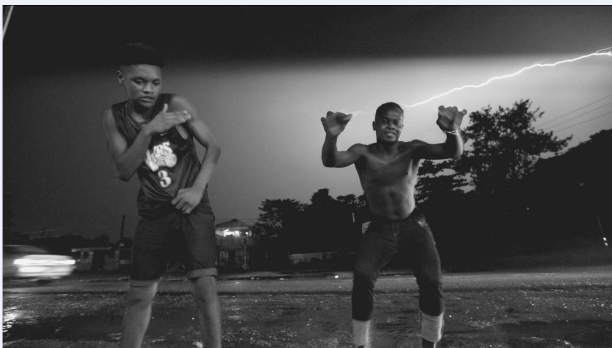
Cecilia Bengolea - Lightning Dance