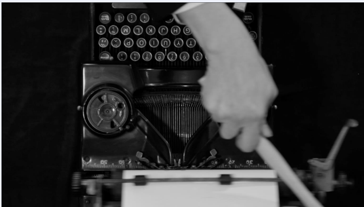
Mounir Fatmi - History is not Mine